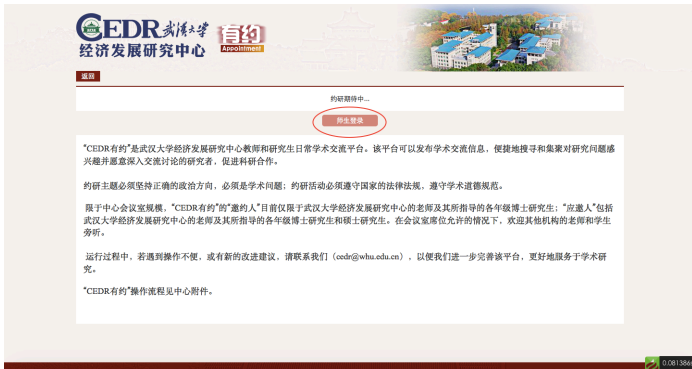
图 2 CEDR 有约登录页面

点击浮动窗口后弹出如图2页面，页面顶部是滚动信息条，显示未来三天内的活动信息（如无活动，则显示“约研期待中”），您可根据自己的兴趣登录参加相关活动或安排自己的活动。下方是“CEDR 有约”的一些说明。点击中间的 师生登录 按钮即可登录。