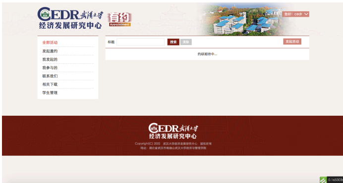
图 4 CEDR 有约主页

登录后的主界面如图4所示。左侧为主要功能栏，右上角为 您好！用户名 ，点击可以修改密码或退出。而主页中间则是所有活动信息，您可根据自己的兴趣进行选择。接下来，我们将会为您详细介绍“CEDR 有约”的详细使用情况。