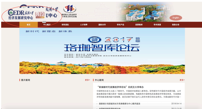
图 1 经济发展研究中心首页