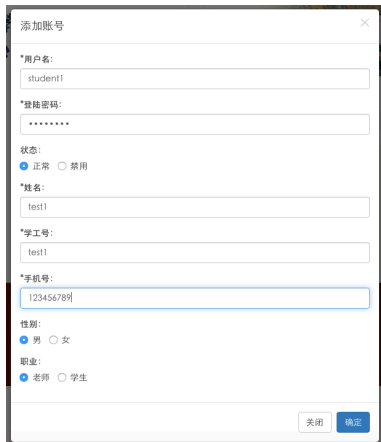
图 8 学生账号授权与禁用管理

学生管理属于中心每位老师的权限，在使用老师账号登录的界面中才会有这一功能，学生账号无此功能。点击主页左侧 学生管理 ，进入如图8界面，填写自己指导的硕士和博士的相关信息。注意：这一活动仅对在读学生开放，如有毕业学生，请及时禁用其账号。请保证所填学生信息真实，联系方式有效。